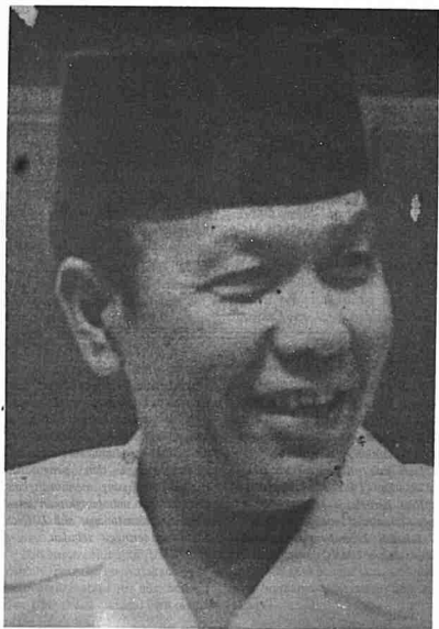
Datuk Harun Idris.