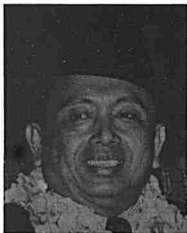
Tan Sri Said Keruak