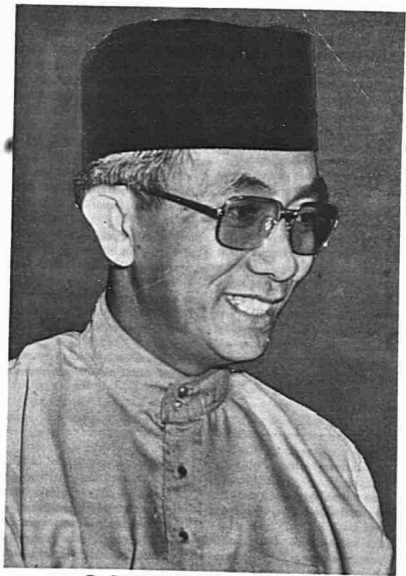
Tun Patinggi Abdul Rahman Yaakub.