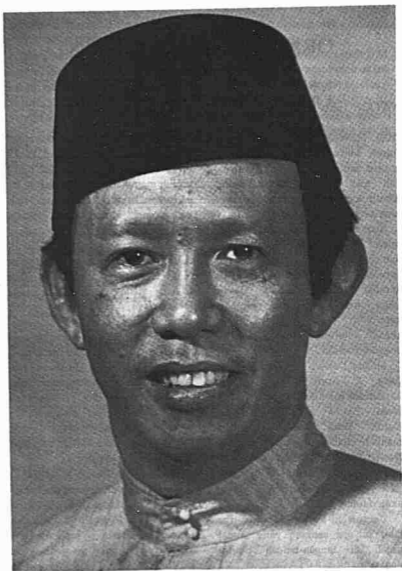
Datuk Musa Hitam menjadi orang harapan Datuk Hussein untuk menyelesaikan masalah Sabah.