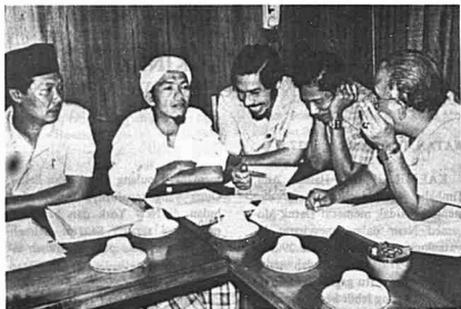
Antara anggota Jawatankuasa Agung PAS 1977