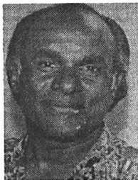
Datuk Sami Vellu

Bising di sini bukanlah dari bunyi suara saja, tetapi bisings itu disebabkan oleh banyaknya benda yang bo-