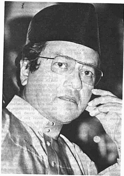
Datuk Sri Dr. Mahathir.