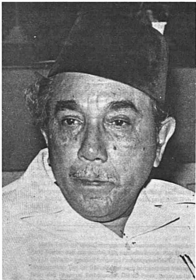
Tan Sri Syed Jaafar Albar.