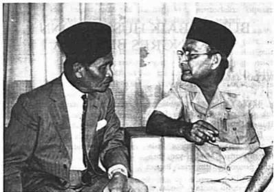
Pertemuan dari hati ke hati antara pemimpin USNO dan pemimpin UMNO.

Datuk Hussein tidak berkata apa-apa tentang perkara itu. Selalunya bila ada pilihanraya kecil, Perdana Menteri akan berkata sesuatu terhadap keputusannya dan keputusan Kimanis itu langsung menyebabkan beliau tak berani untuk berkata apa-apa.